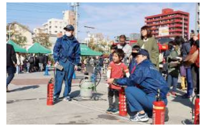
やってみよう!水消火器体験