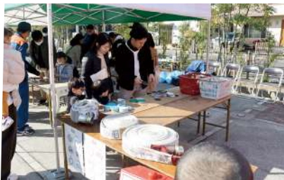
つくろう!消防ホースコースター