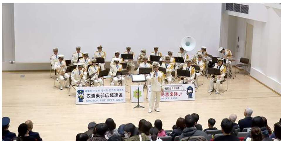
響け!消防局音楽隊