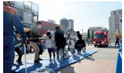
ひっぽろう!消防自動車